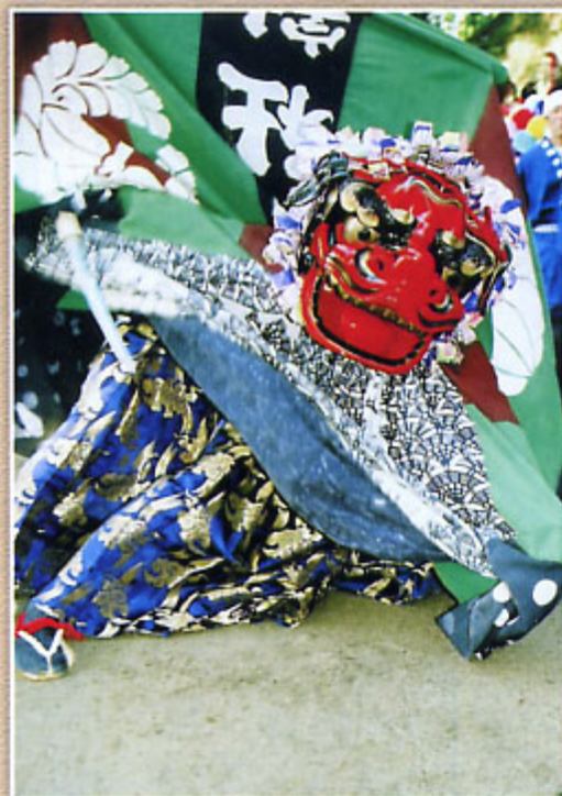
2007年グランプリ「孤軍奮闘」